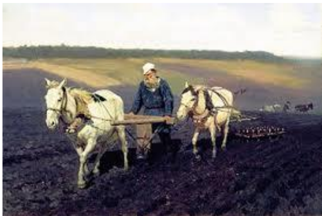
Schilderij: Lev Tolstoj aan het ploegen

Een van Tolstoj’s laatste publicaties was “De wet van liefde en de wet van geweld” (1909).