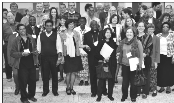
Ong. 50 van de 80 deelnemers aan de Conferentie (Rome, april 2016)

Als antwoord op de wereldwijde geweld-epidemie, door paus Franciscus bestempeld als een ‘wereldoorlog in fasen’, zijn wij geroepen om beslissende