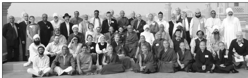
Bijeenkomst van de ‘Elijah Raad van Religieuze Wereldleiders’

Dit Instituut werd opgericht tijdens de eerste ontmoeting van een groot aantal religieuze leiders in Sevilla (Spanje) in 2003 en werd daarna gevestigd in Jeruzalem. Inmiddels zijn er 7 bijeenkomsten van de ‘Elijah Raad van Religieuze Wereldleiders’ geweest, waarbij ongeveer 70 leiders vanuit diverse stromingen binnen o.a. Boeddhisme, Christendom, Hindoeïsme, Islam, Jodendom betrokken zijn. De ‘Elijah Raad’ biedt hen de mogelijkheid voor gesprek en overleg met betrekking tot problemen die in de wereld spelen.