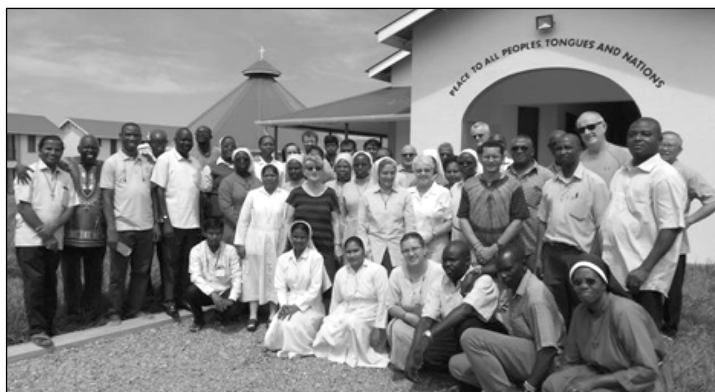
‘Peace to all peoples tongues and nations’ ‘Vrede aan alle tongen van mensen en landen’

Een boodschap met deze titel vormde de afsluiting van een 5-daagse bijeenkomst over ‘Toegewijd Leven’ in het Good Shepherd Peace Centre* (Goede Herder Vredescentrum) in Kit [nabij de hoofdstad Juba (‘Djoeba’)] in het zuiden van Zuid-Soedan, van 24-29 april 2017. (Zie foto.)