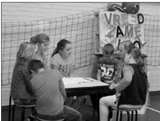
Leerlingen oefenen een groepsgesprekje.

In 2009 werd daar een begin mee gemaakt. Er kwam heel wat bij kijken, maar het succes was duidelijk. Onderzoek door de Universiteit Utrecht bevestigde dit. Het aantal basisscholen in de stad dat het programma invoerde groeide naar zo'n 75%. In de 'krachtwijken' bedroeg dat percentage zelfs 80 tot 90 procent van de scholen. De gemeente stimuleerde de invoering van De Vreedzame Wijk in alle krachtwijken en stelde Caroline Verhoeff, die in 1999 als eerste het programma had ingevoerd, aan tot stedelijk regisseur. Utrecht werd, binnen het kader hiervan, in 2013 de eerste 'vreedzame' stad van Nederland.