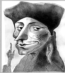
Erasmus: Zoet is de oorlog voor wie hem niet kennen...

EEN HEDENDAAGSE SAMENSPRAAK OVER ERASMUS' VISIE OP OORLOG EN VREDE